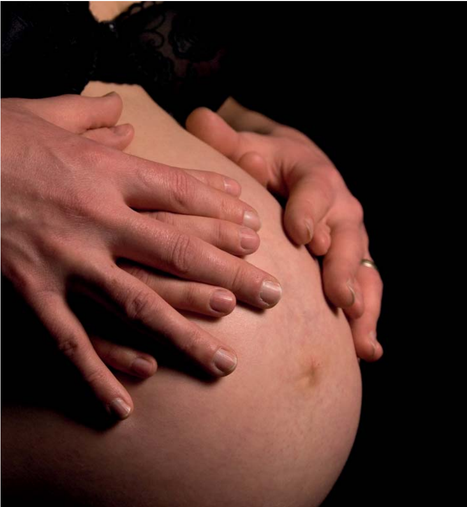
Das Reich Gottes ist zwar bereits eingeführt, aber wir warten auf seine Vollendung